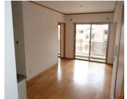
明るいDK (キッチン・南面)