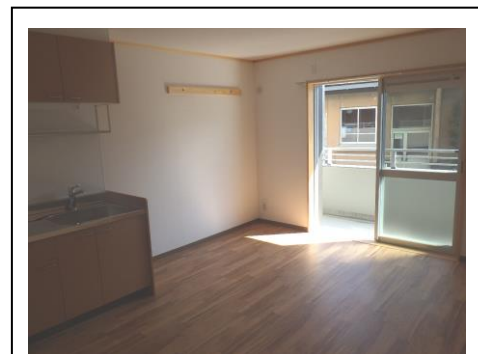
113号室 (Cタイプ 3DK)