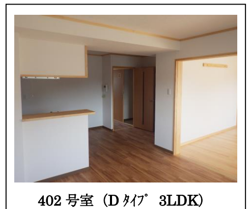
402号室 (Dタイプ 3LDK)