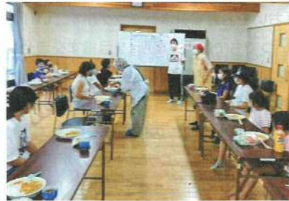
再開後は外での会食予定

▼毎回50食程度を公民館で調理。足りなかったら近隣の店でレトルトを買いに走ることも。食材提供やお菓子の差入れがありがたく、何よりスタッフに感謝していると代表。皆で食事をとる楽しさを知ってもらうのは勿論、地域の大人と子どもと一緒に遊び、つながりを深める地域づくりを目指している。